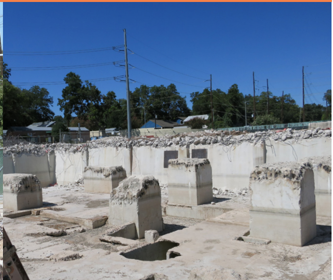
Reinforcement bars will be removed for recycling Las varillas de refuerzo se quitarán para el reciclaje